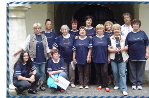
Prva mednarodna likovna kolonija Ustvarjamo skupaj v Avstriji, Retzhof 2009