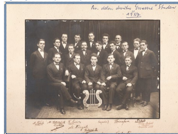
Prva ohranjena slika Kulturnega društva Studenci-Maribor, takrat Pevsko delavsko društvo Enakost leta 1927