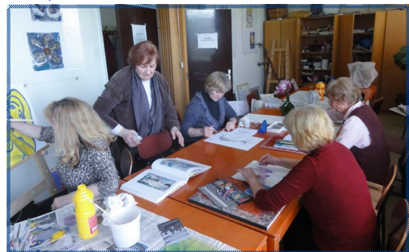
Skupina Zarja - ateljejsko delo