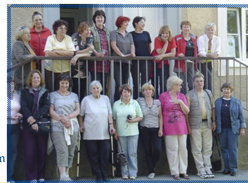
Likovna kolonija Gaj 2010, s skupino Brestart in Likovnim društvom Š. Cobelj, Ptuj