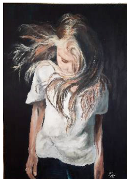
V VETRU, olje

mi je toplo pri srcu, ko se sprehajam po mestu in gledam pročelja hiš, ki smo jih mi obnovili. Vedno sem imela rada umetnost, katerokoli vrsto. Najraje hodim v galerije in občudujem stvaritve umetnikov. Zelo sem si želela tudi sama slikati. Proučevala razne tehnike in se ustavila pri oljnem