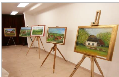
5. likovna kolonija Trnovska vas 2013, SLO