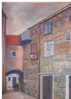
STARA JELSA, akvarel

sem se svoje prve samostojne likovne razstave v Mariborski banki v Lovrencu na Pohorju. Udeležila sem se vseh naših skupnih in samostojnih razstav in tudi večine likovnih kolonij. Slike, nastale v tem času, sem obesila doma v hiši in podarila znancem in sorodnikom. V skupini je vladalo prijateljsko vzdušje, ki smo ga dopolnili s praznovanjem osebnih praznikov. Naša mentorica je vedno poskrbela za nove, zanimive tehnike likovnega ustvarjanja – za novosti, pa tudi klasiko. Radi ustvarjamo, se družimo in postajamo pravi prijatelji.