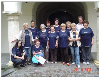
1. likovna kolonija Retzhof 2009, A