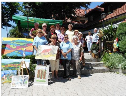
4. likovna kolonija Šentanel 2012, SLO