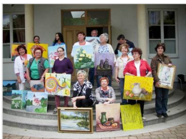
6 . likovna kolonija Veržej 2014 SLO