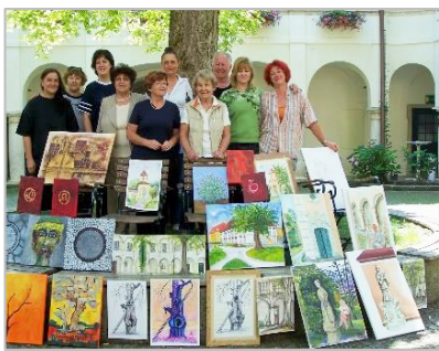
2. likovna kolonija Retzhof 2010, A