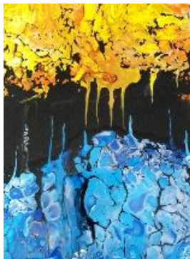
DVA SVETOVA, puring

zatekala ob petkih popoldan 14 let, mi je omogočil odklop vsakodnevnih skrbi, ki so bile prisotne v službi in doma. In ta svet barv mi je buril domišljijo, ki sem jo prelivala na papir in platno. Meni so slike pomenile še več - bile so odsev moje duše, ki ga nerada razkrivam drugim. Izražati se z barvami je kot napisati lepo pesem ali zgodbo. Ko primerjam svoje začetne izdelke z današnjimi, vidim napredek, ki sem ga lovila vsa ta leta. Hvala mentorici in mojim kolegom, ljubiteljem likovnega upodabljanja, za neprecenljive trenutke, ki smo jih preživljali in preživeli skupaj. Naj vas ustvarjani duh nikoli ne zapusti!