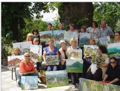
3. likovna kolonija Šentanel 2011, SLO