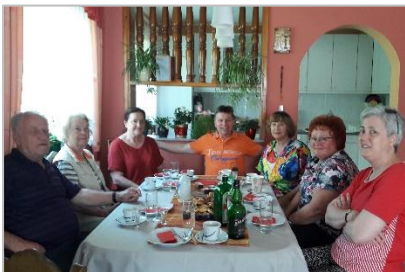
8. likovna kolonija Klenovnik 2017 HR