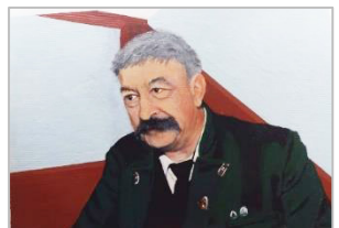
BRAT TONČEK, akril

Zaključujem z mislijo, da niso pomembne statistike in številke, niti to, kako umetniško dovršeni in gledalcem všečni so naši izdelki. Pomembno je zgolj