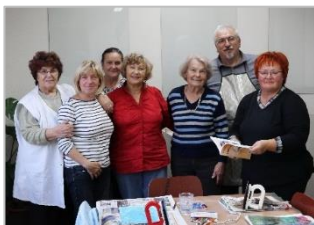
LISE pri delu z voski