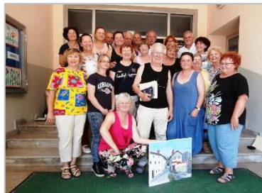
7. likovna kolonija Branik 2015 HR