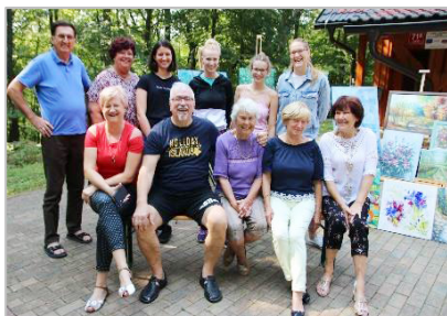
10. likovna kolonija Goričko 2020, SLO