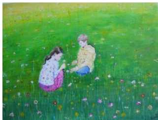
NA TRATI, akril