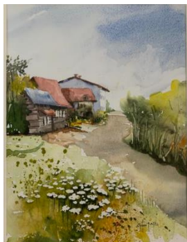
LEPOTE NARAVE, akvarel