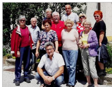
9. likovna kolonija Jeruzalem 2018, SLO